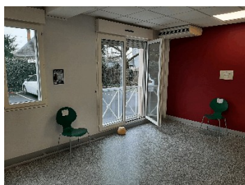
Salle d'attente (version COVID)