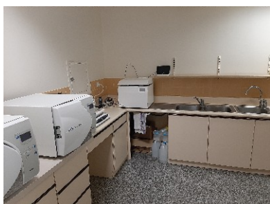
Autoclave TECNOGAZ Thermosoudeuse